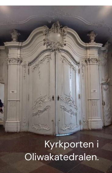
Kyrkporten i Oliwakatedralen.

oändligt lång, vilket den är för att vara en kyrka. 107 meter lång med 23 altare och en majestätisk orgel från 1700-talet. Konfirmanderna fick uppleva en mindre orgelkonsert vid besöket och det var väldigt mäktigt.