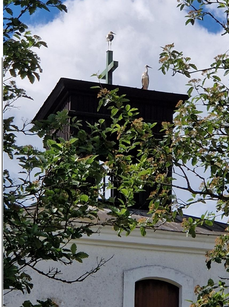
Storkarna som häckar på Fågeltofta kyrktorn.