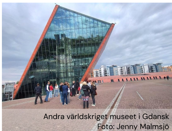
Andra världskriget museet i Gdansk

Under 4 dagar besökte de bland annat "Andra världskrigs museet" i Gdansk som är ett av världens största och modernaste krigshistoriska museer som skildrar kriget på djupet med tonvikt på civilbefolkningens upplevelser och det globala händelseförloppet.