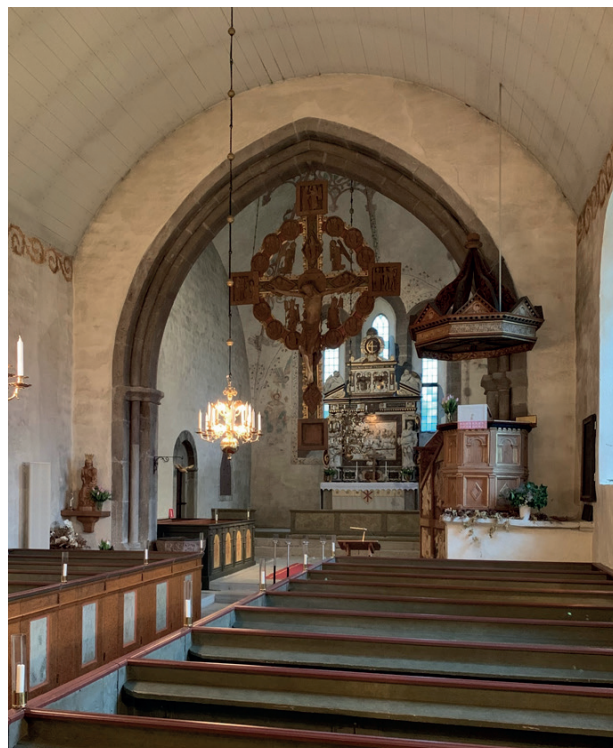
Kyrkan från sydöst före restaureringen. Nedan kyrkorummet mot väster och öster före restaureringen.