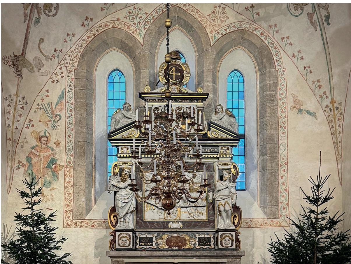
Kyrkorummet mot öster efter restaureringen. Foto: Lars Bäckman, 2024. När dessa två bilder togs var pastoratets personal i full gång med att iordningställa kyrkan efter restaureringen och inför återöppnandet.