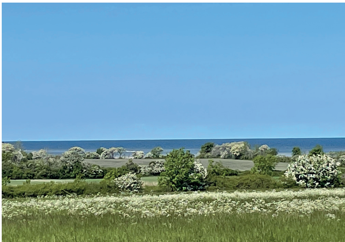
Utsikt från Fröjel kyrka.