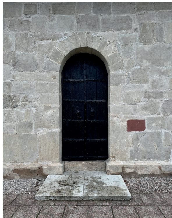
Bilder efter restaureringen. Strävpelaren i väster var helt täckt av murgröna som nu har tagits bort. Till höger långhusportalen, med den inmurade röda stenen. Dörrar, tak och tornspira har tjärats.