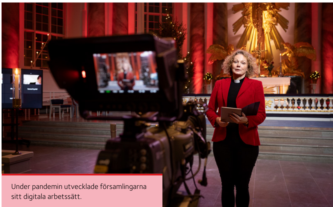
Under pandemin utvecklade församlingarna sitt digitala arbetssätt.

Till kyrkan är alla lika välkomna. Det gäller oavsett om man vill fira gudstjänst, lyssna på musik, sjunga i kör, samtala med någon, uppleva arkitektur och historia, reflektera, tända ett ljus eller delta i församlingens aktiviteter. Det erbjuds även grundläggande undervisning i kristen tro och det finns möjlighet till fördjupning för den som är intresserad.