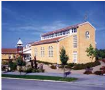
Maria Magdalena kyrka Flygelvägen 1 224 72 Lund