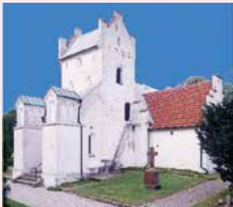
Stora Råby kyrka Stora Råby byaväg 7 224 80 Lund