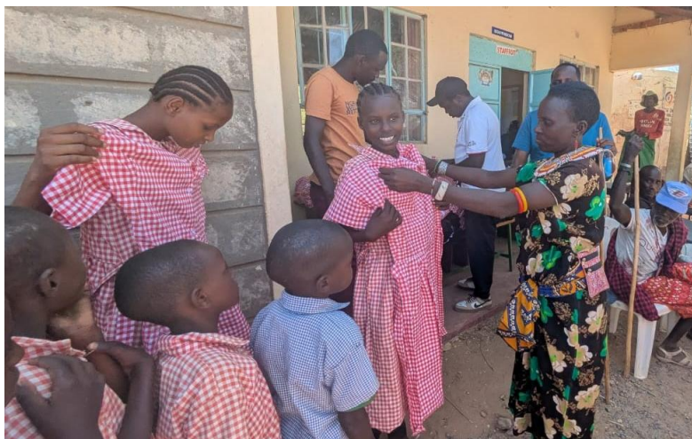
Eleverna på skolan provar sina nya skoluniformer i januari 2025

Som vanligt erhöll samtliga elever nya skoluniformer när terminen började i januari efter en insamling och kollekt i Två Systrars Kapell.