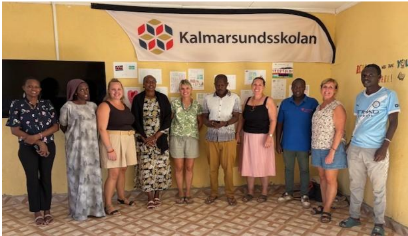
Lärarna på skolan tillsammans med fyra lärare från Kalmarsundsskolan, oktober 2025.