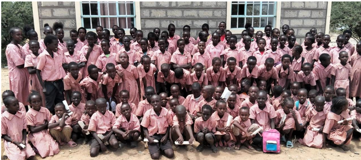
En stor del av eleverna i primary school

I skolan fanns under det gångna året sju klasser: pre-primary 1 och 2, årskurs 1-5, totalt 258 elever, fördelade på 151 flickor och 107 pojkar.