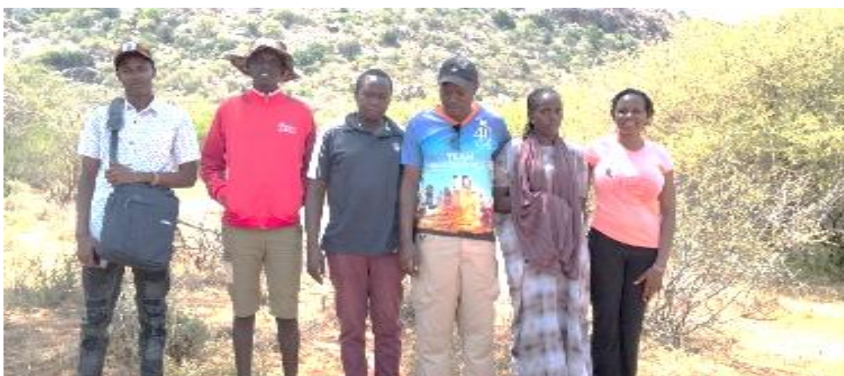
Personalen på Two Sisters School

I juni genomfördes de årliga teambuildings- och fortbildningsdagarna för skolans lärare, denna gång i Ngurunit, med besök på Ngurunit Primary och Salato Primary Schools. Den här fortbildningen är möjlig tack vare stöd från månadsgivarna i Två Systrars Kapell.