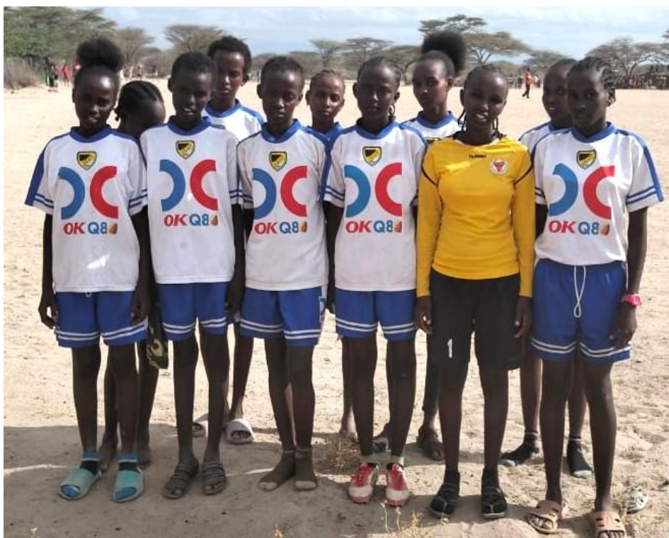
Two Sisters Schools fotbollslag för flickor, iklädda tröjor och shorts skänkta av Läckeby Golf.