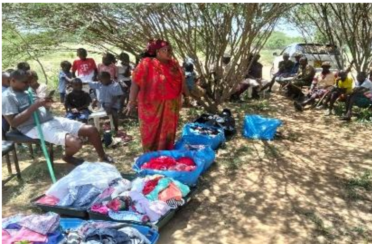
De Kenyanska lärarna fick med sig hem barnkläder som skänkts till kapellet och som blev till god nytta i Two Sisters Village. Här vid utdelningen efter hemkomsten.