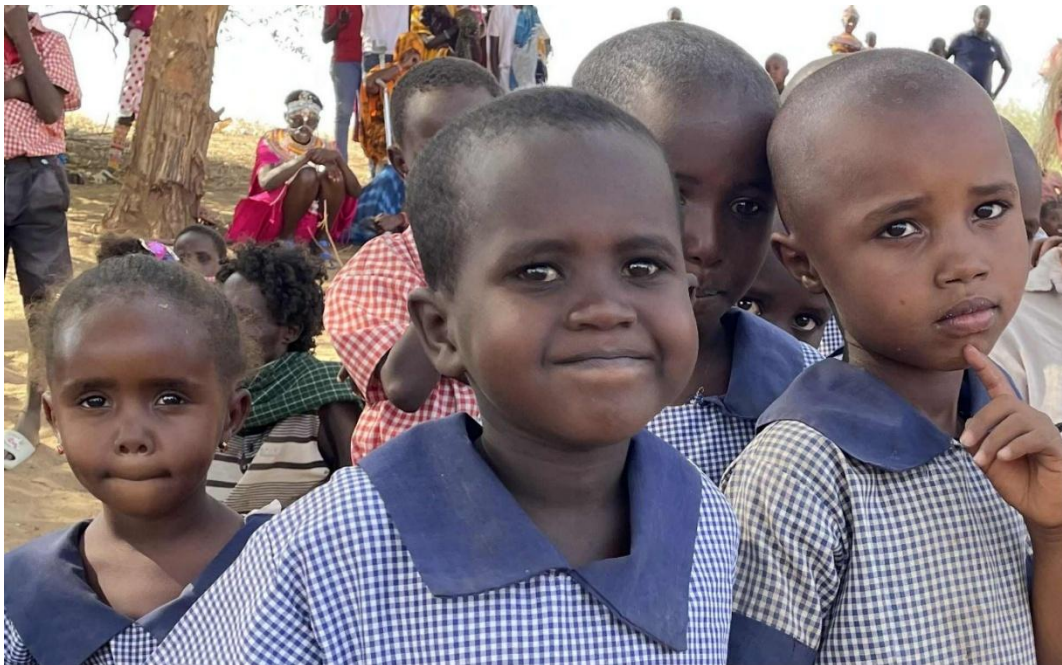
Glada och lite förundrade förskoleelever