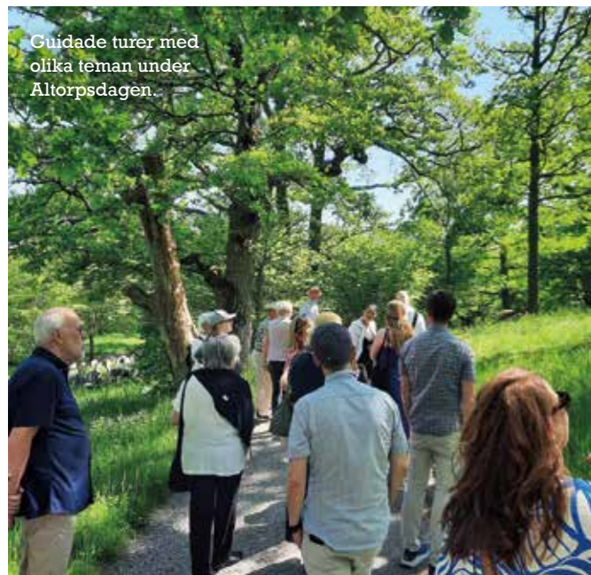
Guidade turer med olika teman under Altorpsdagen.