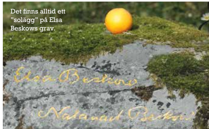
Det finns alltid ett "solägg" på Elsa Beskows grav.