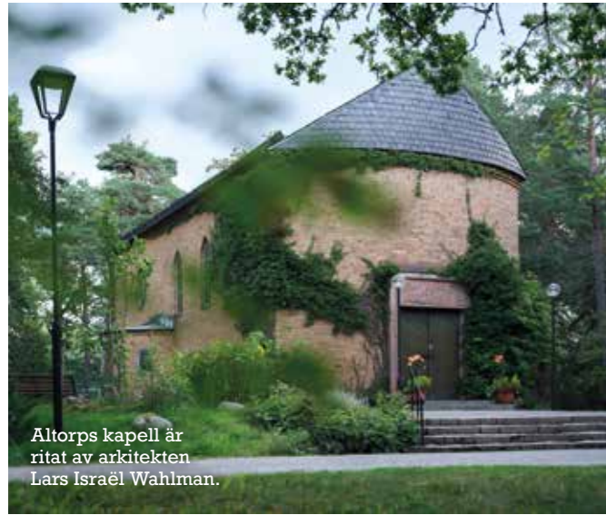
Altorps kapell är ritat av arkitekten Lars Israël Wahlman.