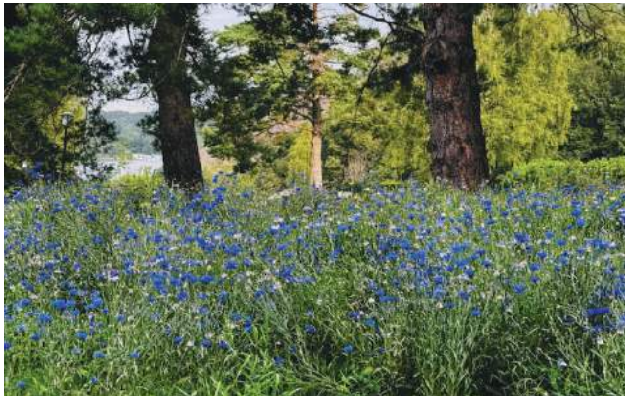
Blåklint på kullen ovanför barnkvarteret S:t Botvids begravningsplats.