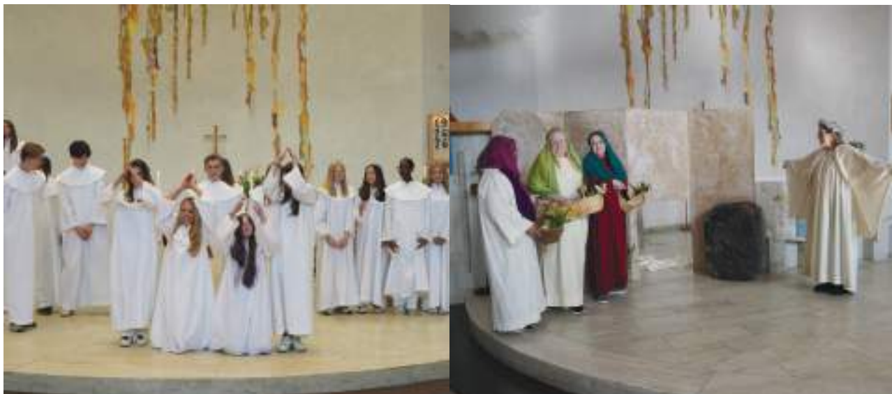
Bilden till vänster: konfirmander (Paris/Berlin) gör en dramatisering. Bilden till höger: påskvandring för förskole- och långstadieklasse.