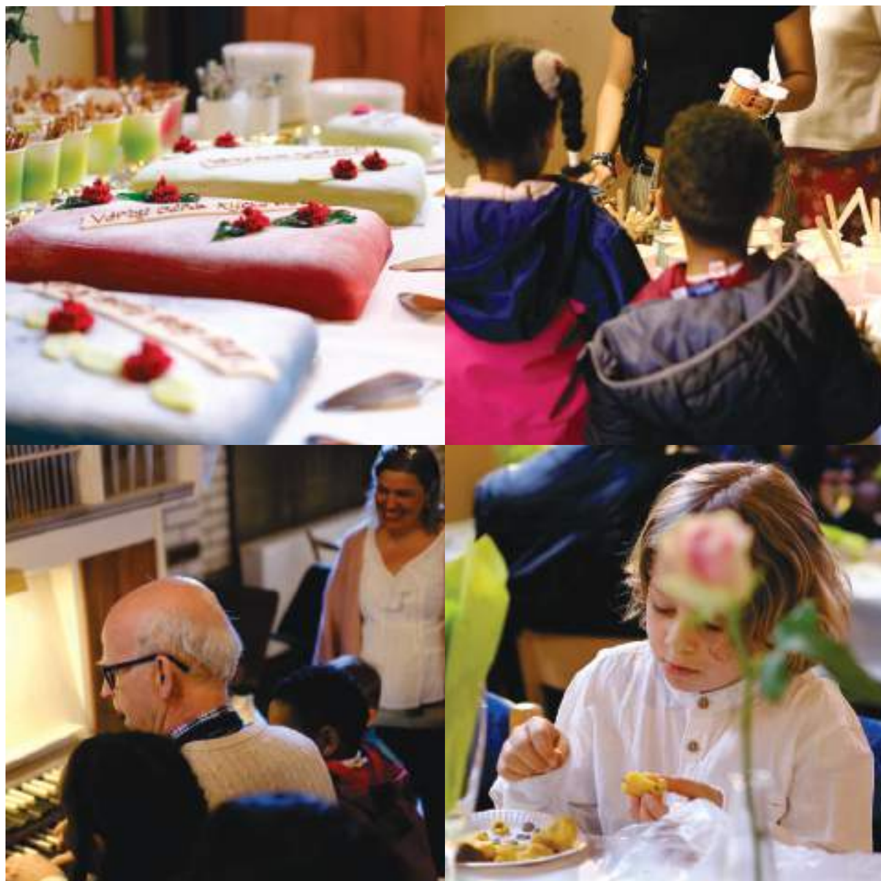
Bilder från guidad visning, glassfest och festmåltiden.

personer till jubileumsmässa i kyrkan. Efter gudstjänsten fortsatte firandet med festmåltid, där omkring 170 deltagare samlades runt en vegansk buffé och färggranna tårter. Det hölls tal och spontana inslag tog plats – bland annat lovsång på grekiska – vilket gav avslutningen en varm och festlig prägel.