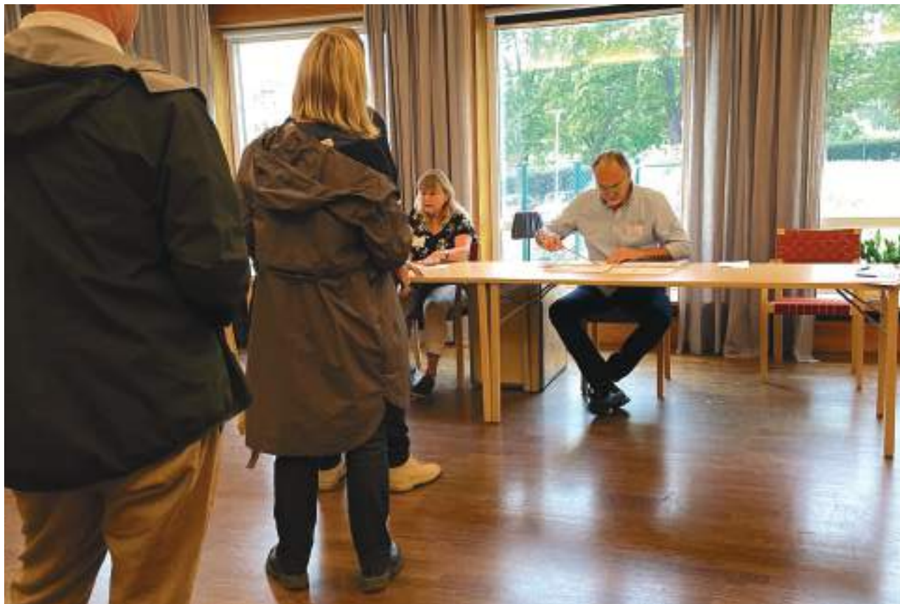
Röstning i Klockargården i Huddinge.

fortsätta vara relevant, både i nutid och i framtid. I kyrkovalet deltar ett antal nomineringsgrupper, varav vissa har koppling till politiska partier. Till skillnad från de allmänna valen benämns de grupper som ställer upp i kyrkovalet just som nomineringsgrupper.