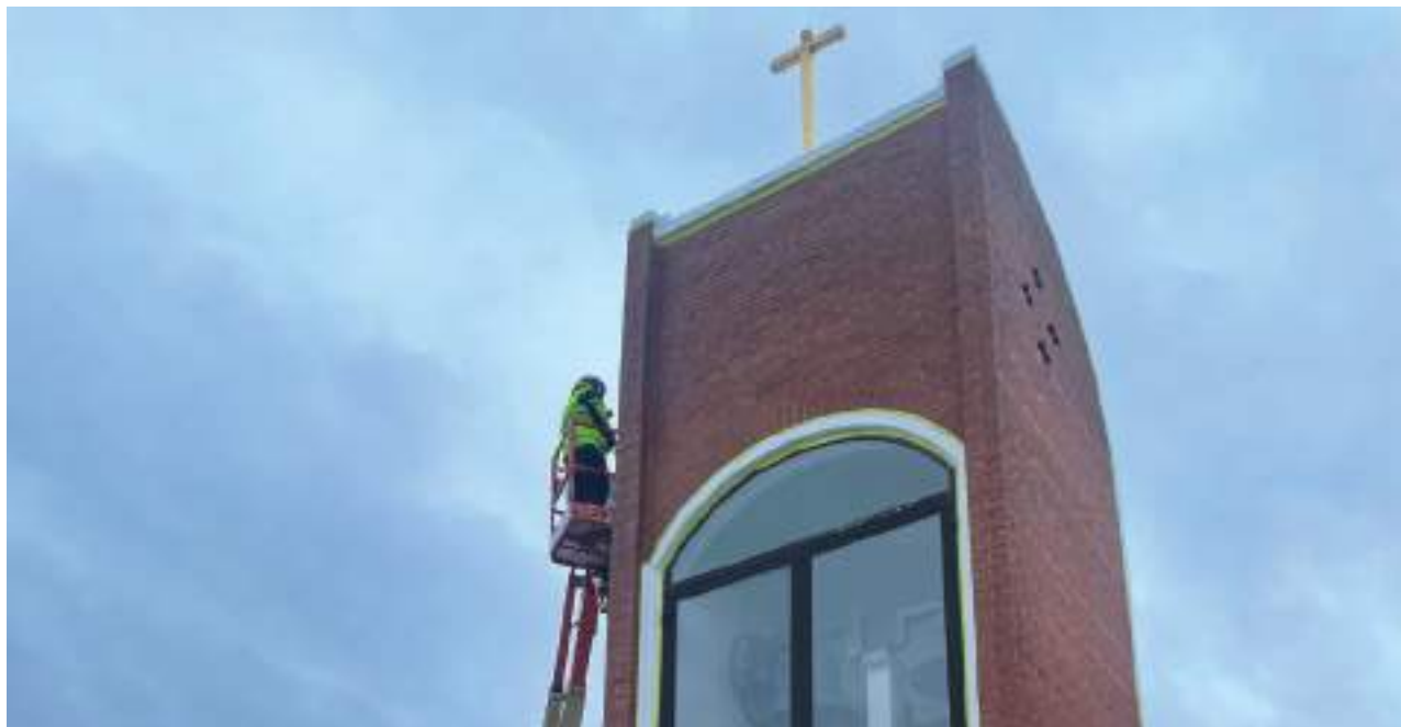
Under hösten renoverades Mariakyrkans klockstapel.

fastighetsbeståndet, vara beställarstöd och ha funktion som byggherreombud/projektledare för underhållsprojekt och investeringsprojekt samt hantera myndighetsansökningar. De kyrkliga fastigheterna vårdas och underhålls enligt bestämmelserna i kyrkoordningen. Av lagen (1988:950) om kulturminnen finns ytterligare bestämmelser om vården av kyrkobyggnader och inventarier.