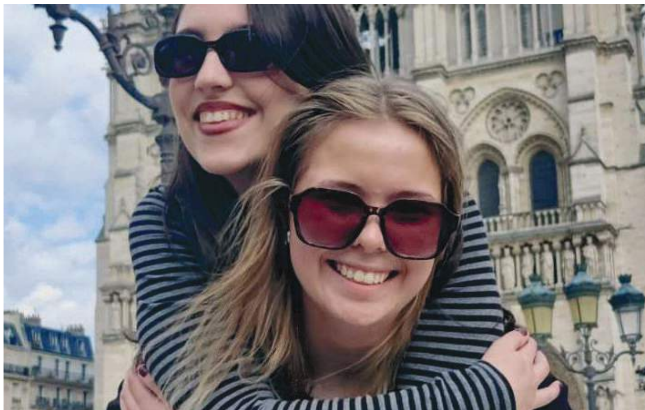
Konfirmander i Paris.