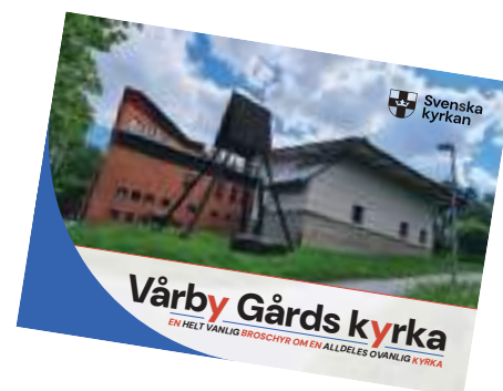
Den nya broschyren om Vårby Gårds kyrka.

När firandet var över kunde personal och ideella medarbetare se tillbaka på intensiva och mycket lyckade jubileumsdagar. Jubileumsveckan blev inte bara en tillbakablick på 50 år av historia, utan också ett levande uttryck för Vårby Gårds kyrkas roll i dag.