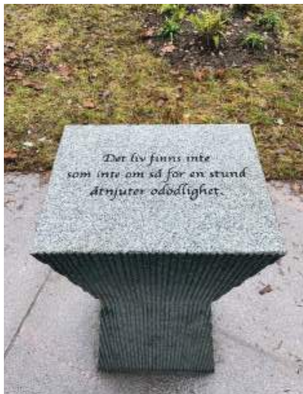
Ceremonibord i sten vid Tomtberga nya askgravlund.