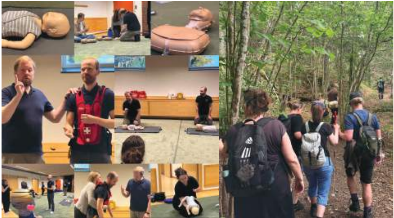
Bilder från årets verksamhet.