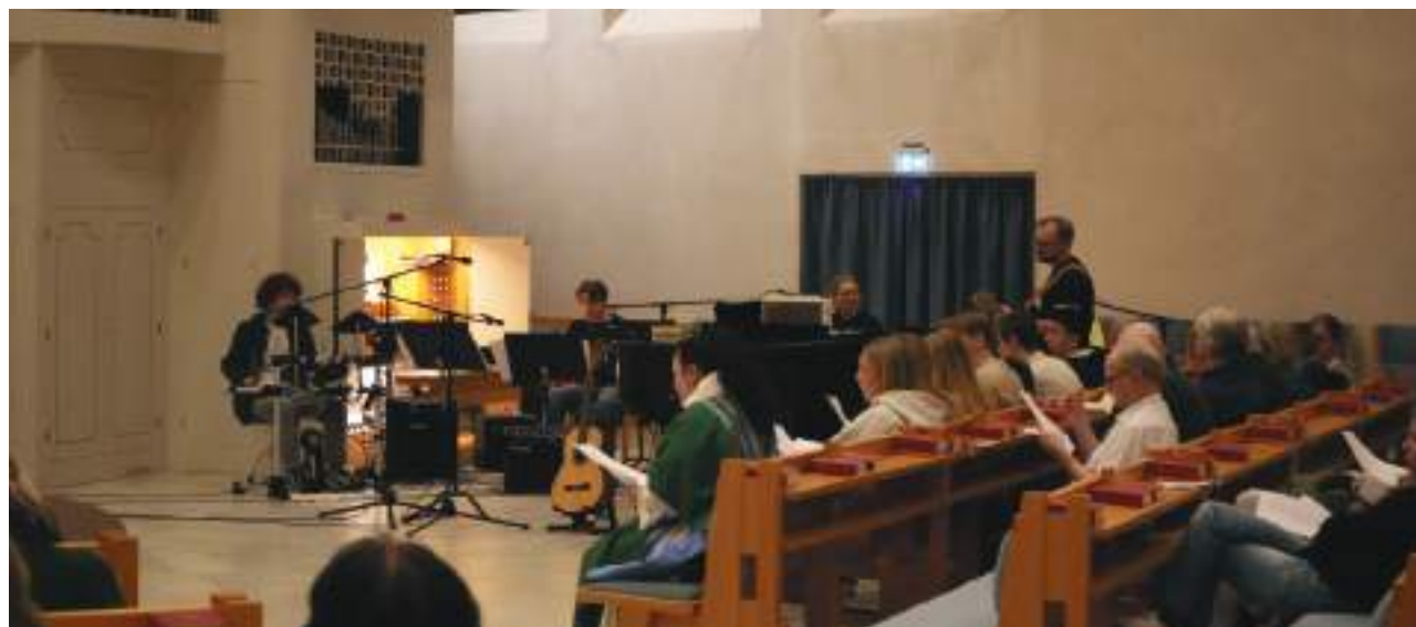
Den 20 februari hölls en Kentmessa i Mariakyrkan. En messa med ungdomsmusiker med musik av Sveriges största rockband, Kent.