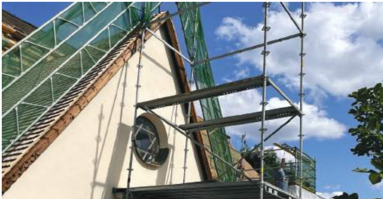
Renovering av Huddinge kyrkas spåntak.