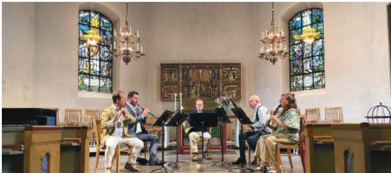
Lunchmusik i Huddinge kyrka.