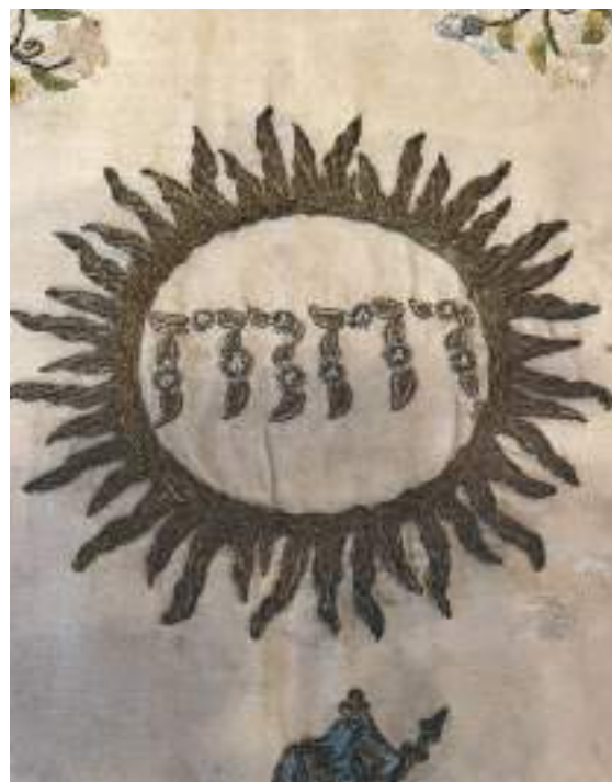
Till vänster: Kalkduk från 1749 som finns i Huddinge kyrka. Till höger: Broderad sol med inskriptionen Jehova på hebreiska.