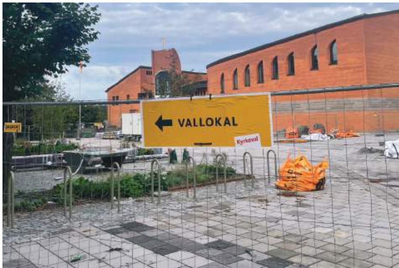
En av alla vallokaler i Huddinge pastorat var i Mariakyrkan i Skogås. Ingången skyltades upp runt kyrkan.