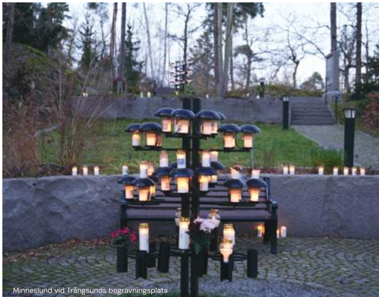
Minneslund vid Trångsunds begravningsplats