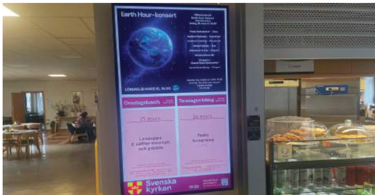
En av pastoratets digitala anslagstavlor finns i Café Maria i Mariakyrkan i Skogås.