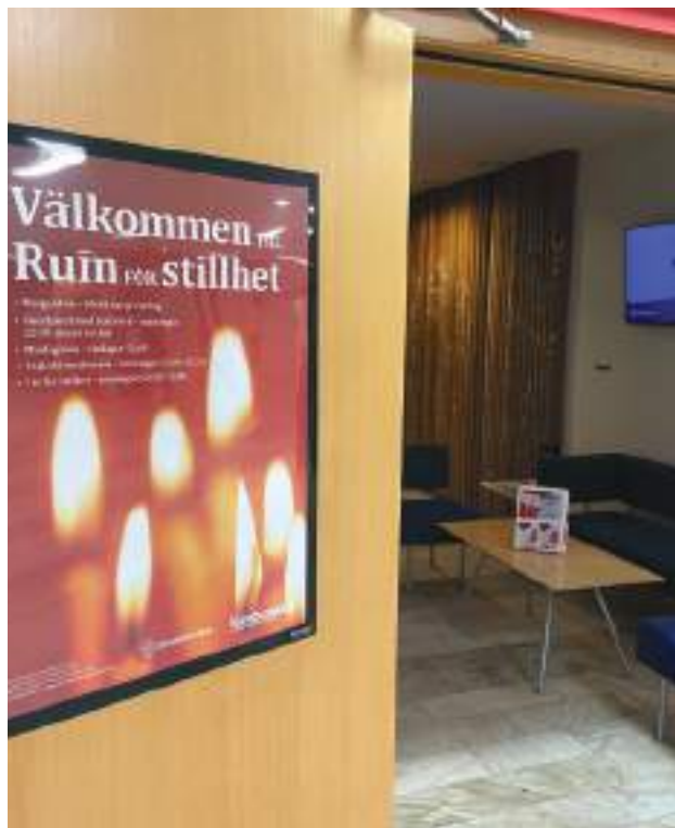
Rum för stillhet.

Året präglades av hög efterfrågan samtidigt som minskade personalresurser inneburit ökad belastning och behov av fortsatt översyn av beredskap.