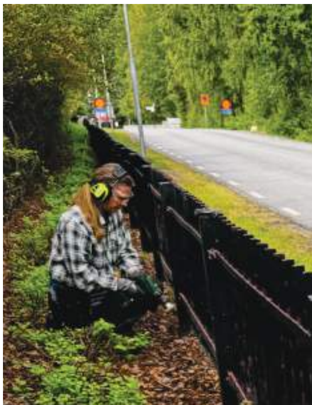
Upprustning och målning av staket vid S:t Botvids begravningsplats

Här följer lite av andra arbeten som utfördes eller startades 2025: