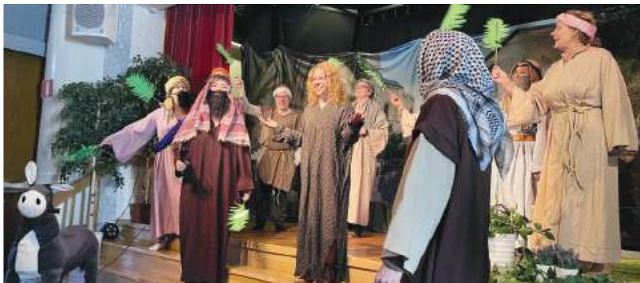
Påskspel i Klockargården.

allhelgona och jul. Dessutom firas regelbundet gudstjänster och andakter på sex äldre- och seniorboenden i upptagningsområdet.