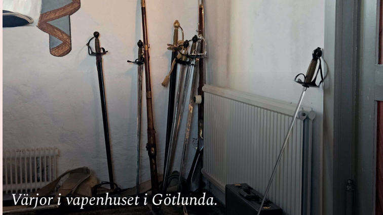
Värjor i vapenhuset i Götlunda.