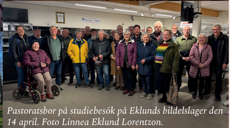
Pastoratsbor på studiebesök på Eklunds bildslager den 14 april.