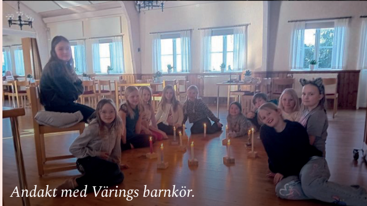
Andakt med Värings barnkör.