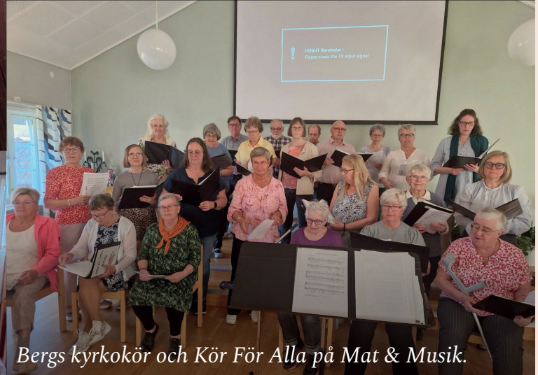
Bergs kyrkokör och Kör För Alla på Mat & Musik.