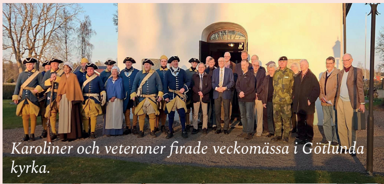
Karoliner och veteraner firade veckomässa i Götlunda kyrka.