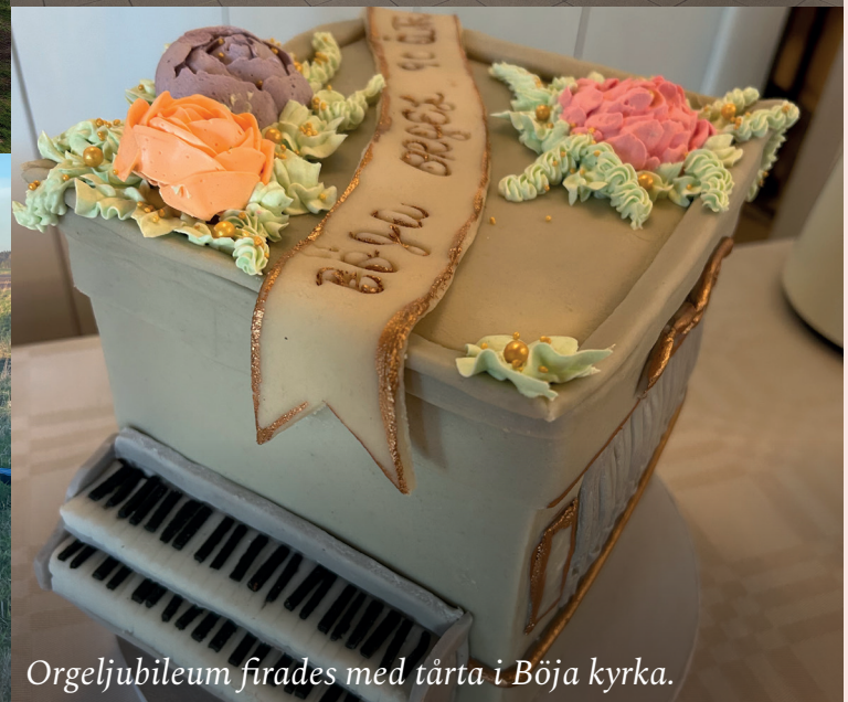
Orgeljubileum firades med tårta i Böja kyrka.