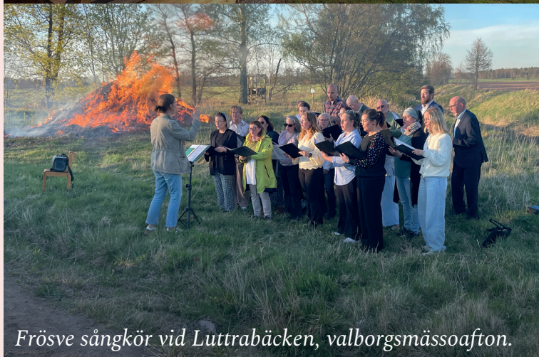
Frösve sångkör vid Lutrabäcken, valborgsmässoafton.