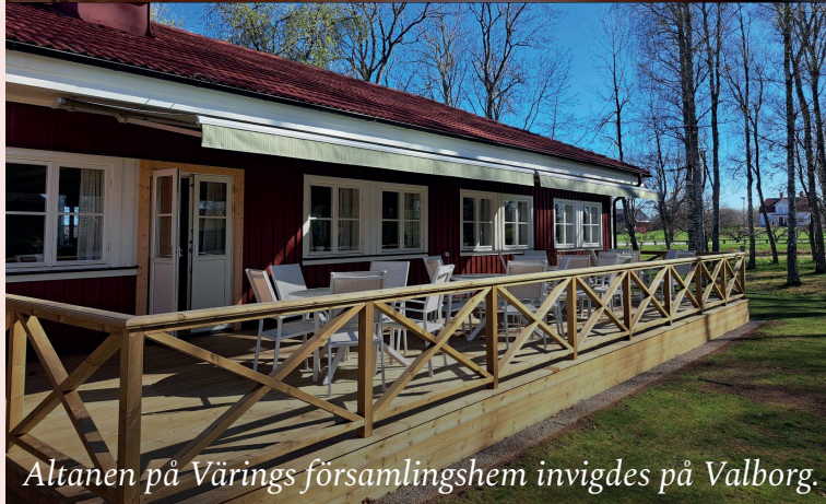
Altanen på Värings församlingshem invigdes på Valborg.