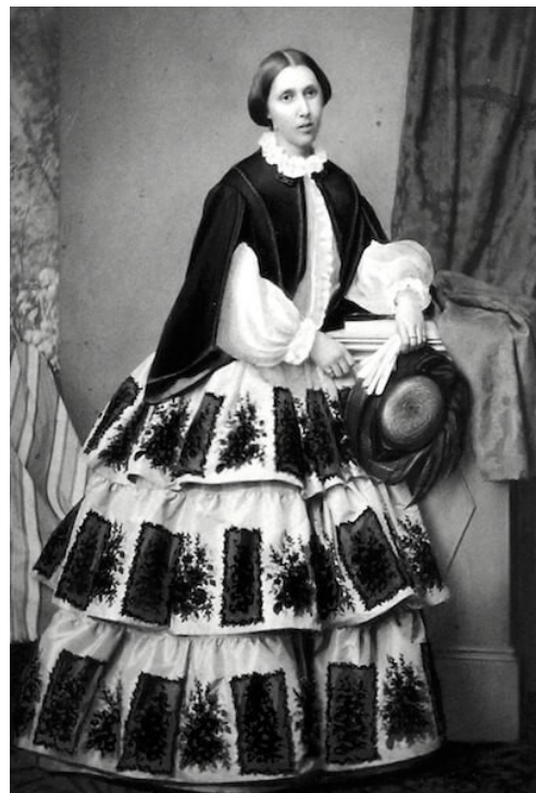
Hennes Kungliga Höghet Eugénie, Prinsessa av Sverige och Norge